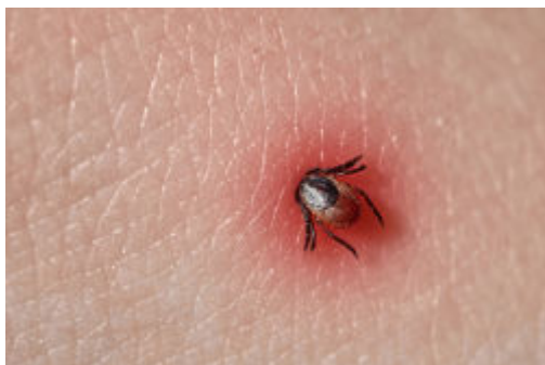
Zeckenstich mit Entzündung